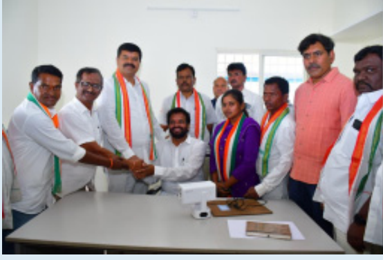
మణుగూరు, ఫిబ్రవరి 02 (భారతశక్తి): ప్రజా పాలనలో గ్రామీణ ప్రాంతాల అభివృద్ధి లక్ష్యమని పిన్ పాక నియోజకవర్గ

-విద్యుత్ శాఖ అభివృద్ధిలో మరో కీలక ఘట్టం -ఎలక్ట్రికల్ ఏడి కార్యాలయ నూతనభవనాన్ని ప్రారంభించిన ఎమ్మెల్యే పాయం