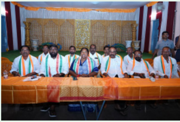
ఈసారి ట్రాఫిక్ సమస్యలు చాలా వరకు తగ్గయిన పేర్కొన్నారు. కొంతమంది వివిధ వందలాది మందితో, అనేక వాహనాలతో రావడం వల్లే ఇబ్బందులు తలెత్తాయన్నారు.

ములుగు జిల్లా ప్రతినిధి, ఫిబ్రవరి 02 (భారత శక్తి): ప్రపంచ ప్రఖ్యాతి చెందిన మేడారం సమృద్ధి-సారలమ్మ మహాజాతర ప్రతిష్ఠను దెబ్బతీసేలా కావాలనే కొంతమంది రాజకీయ పార్టీలు, కొన్ని మీడియా సంస్థలు, కొందరు స్వాములు తప్పుడు ప్రచారాలకు పాల్పడుతున్నారని పంచాయతీరాజ్ గ్రామీణ అభివృద్ధి స్త్రీ-శిశు సంక్షేమ శాఖ మంత్రి సీతక్క ఆగ్రహం వ్యక్తం చేశారు. ములుగు జిల్లా కేంద్రంలోని డిఎల్ఆర్ ఫంక్షన్ హాల్ లో శుక్రవారం ఏర్పాటుచేసిన మీడియాసమావేశంలో ఆమె మాట్లాడారు. మేడారం జాతర నిర్వహణలో భాగంగా వారం రోజుల పాటు తాము 24 గంటలూ అక్కడే ఉండి పనిచేశామని, కోట్లాది మంది భక్తులు సుఖశాంతలతో దర్శనం చేసుకున్నారని తెలిపారు. జాతరను సక్సెస్ చేయడంలో సహకరించిన ములుగు జిల్లా మీడియా సోదరులకు, అధికారులు, పోలీసులు, పారిశుధ్య సిబ్బందికి మంత్రి కృతజ్ఞతలు తెలిపారు. గుడి నిర్మాణం ప్రారంభమైన నాటి నుంచే ఆదివాసీ విశ్వాసాలకు వ్యతిరేకమని తప్పుడు ప్రచారాలు సాగుతున్నాయని పేర్కొన్నారు. గుడిలో చేసిన ప్రతి మార్పు పూజారుల ఆమోదం, ఎండోమెంట్ కమిషనర్ అనుమతితోనే జరిగిందని స్పష్టం చేశారు. అయినప్పటికీ సమృద్ధి గడ్డల వద్ద కూడా రాజకీయాల చేయడం దురదృష్టకరమన్నారు. శుక్రవారం సాయంత్రం వివిధ వాహనాలు భారీగా రావడంతో కొంత సమస్య త్రాఫిక్ ఇబ్బంది ఏర్పడిందని, అది బస్సులు లేకపోవడం వల్ల కాదని తెలిపారు. గత జాతరలతో పోలిస్తే