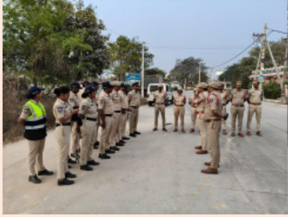
తెలిపారు. సామాజిక మాధ్యమాల్లో రెచ్చగొట్టే విధంగా పోస్టులు పెడితే చట్టపరమైన చర్యలు తీసుకుంటామన్నారు.

ఇందులో భాగంగా మేడ్చల్ పోలీస్ స్టేషన్ సిబ్బంది, దుండిగల్ పోలీస్ సిబ్బంది, జోనల్ ఫోర్స్ తో కలిసి రావల్పేట్ గ్రామ పరిధిలో వాహనాల తనిఖీలు, ఫుట్ ప్యాట్రోలింగ్ నిర్వహించినట్లు తెలిపారు. అనుమానాస్పద కదలికలపై నిఘా ఉంచి వాహనాలను క్షుణ్ణంగా తనిఖీ చేశామని పేర్కొన్నారు. ప్రజల్లో భద్రతాభావాన్ని పెంపొందించడంతో పాటు ఎలాంటి అవాంఛనీయ ఘటనలు జరగకుండా ఉండేందుకు విజిబుల్ పోలీసింగ్ చేపట్టినట్లు ఇన్స్పెక్టర్